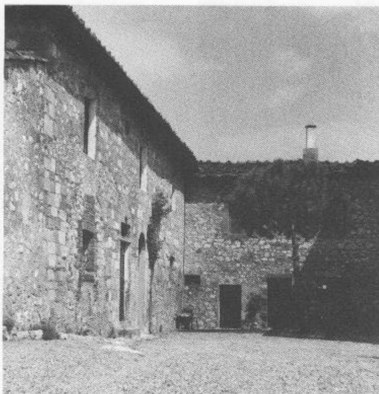
Nella pagina a fronte. Il 'Palazzo', com'era detta la villa del Poggio (Cercignano), e un particolare della facciata con la porta d'ingresso e le panche di pietra. Qui sopra la casa colonica degli Albieri (Righi) a fianco del 'Palazzo'.