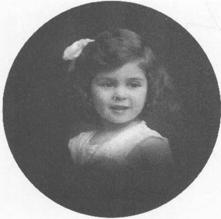
Isa da piccina (non ancora due anni e mezzo), quando tutti la chiamavano Zippo.