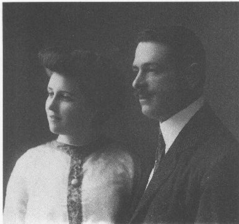
I genitori di Isa e di Lia al tempo del loro matrimonio.